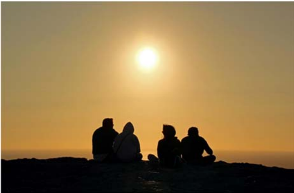
Freunde beim Sonnenuntergang an der Küste