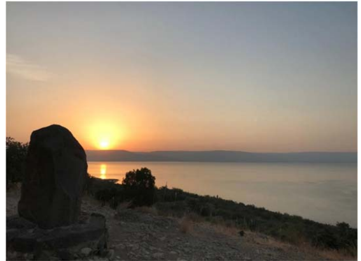
Sonnenaufgang am See Genesareth

wir haben die Jahresmitte erreicht. Und im Monat Juni steht ein Wendepunkt.