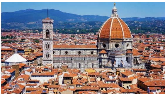
Kathedrale Santa Maria del Fiore – Florenz

Aber ich hatte mir vorgenommen, auch die dortigen Gottesdienste mitzuerleben. Einer davon ist mir besonders im Gedächtnis geblieben. Es war in Florenz.