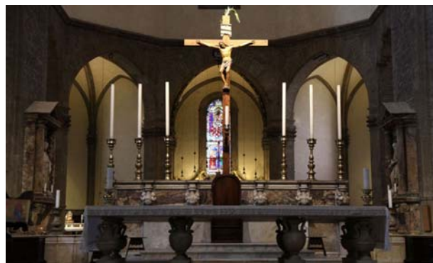
Dom von Florenz