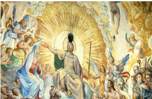
Dom Florenz

Gastfreundschaft ist eine urchristliche Tugend, die in zwei Richtungen geht, wir müssen bei uns gute Gastgeber sein, aber in der Fremde auch gute Gäste.