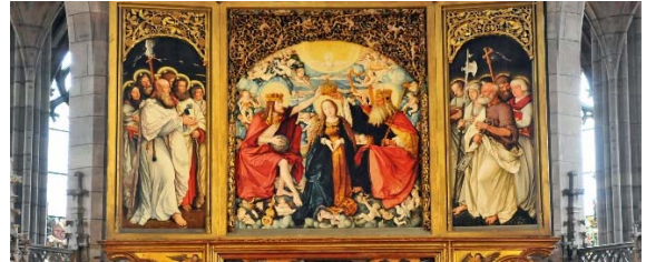
Freiburger Münster

Fenster nicht als reine Kunstobjekte, sondern als Ausdrücke eines Glaubens, der die Zeiten überdauert.