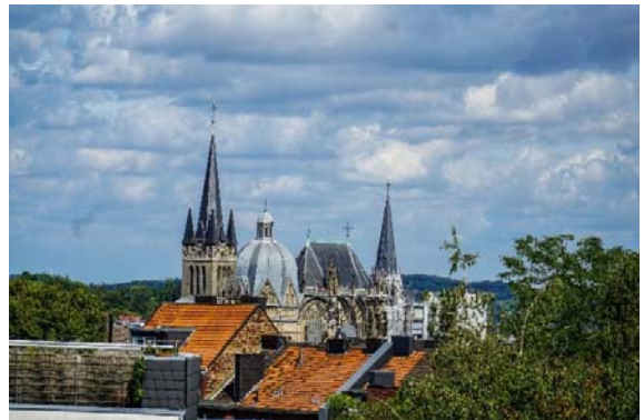
Aachener Dom

Man betritt den Innenraum, wenn die Kirche eine gewisse Bekanntheit hat, oder zumindest in einer großen Stadt steht, gibt es neben Broschüren vermutlich auch schon die Möglichkeit sich digital etwas anzuhören, möglicherweise gibt es auch irgendwo einen Shop, der Erinnerungsstücke verkauft, deren Preis dann zum Erhalt der Kirche dienen mag.