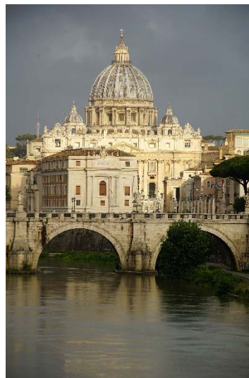
Petersdom - Rom

Man betritt den Innenraum, wenn die Kirche eine gewisse Bekanntheit hat, oder zumindest in einer großen Stadt steht, gibt es neben Broschüren vermutlich auch schon die Möglichkeit sich digital etwas anzuhören, möglicherweise gibt es auch irgendwo einen Shop, der Erinnerungsstücke verkauft, deren Preis dann zum Erhalt der Kirche dienen mag.