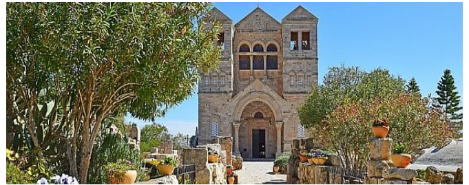
Verklärungskirche auf dem Berg Tabor

Und wenn uns solche winzigen heiligen Momente im Leben geschenkt werden, dann sollten wir sie im Herzen bewahren.